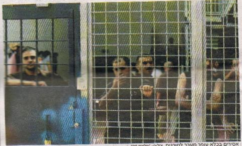
אסירים בכלא עופר מעבר לסורגים.

■ חברים מועדת חוץ וביטחון ביקרו אתמול בכלא הביטחוני עופר, ונדהמו מהתנאים הטובים של המחבלים בכלא ■ בתום הביקור דרשו להשוות את תנאי מאסרם לאלה של החייל החטוף ■